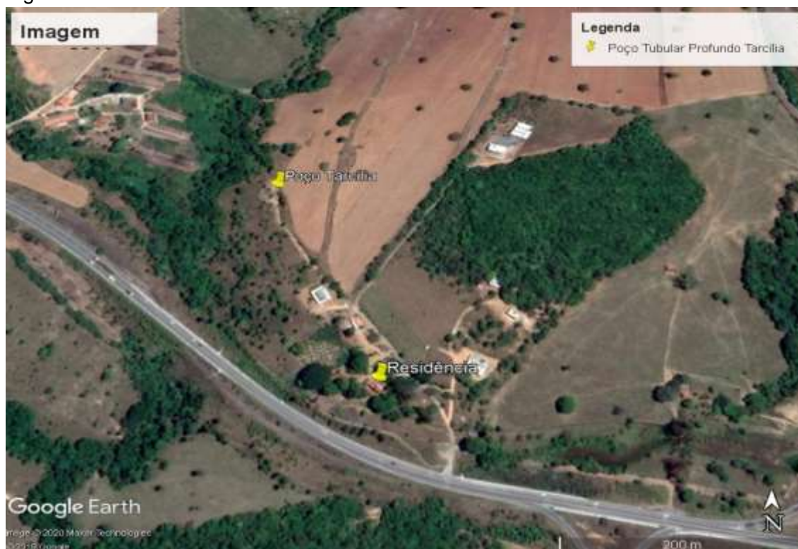
Figura 1- ÁREA RURAL DE FORMIGA – PRÓXIMO AO TREVÃO DE ARCOS